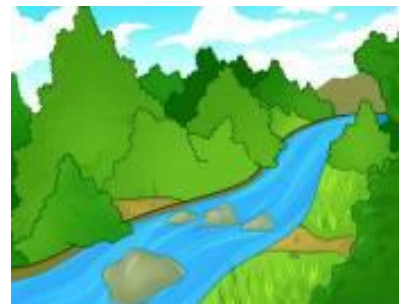
No rio Jordão

ORAÇÃO – LEIA E A CRIANÇA REPETE: Senhor Deus, eu quero fazer o que tu mandas. Em nome de Jesus. amém.