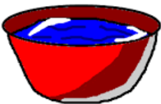
Em uma bacia

Atividade: Circule onde Eliseu mandou Naamã tomar banho: